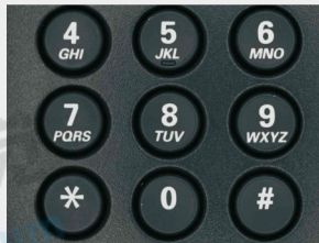
按键字符检测的成像效果