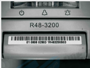
条形码字符读取的成像效果